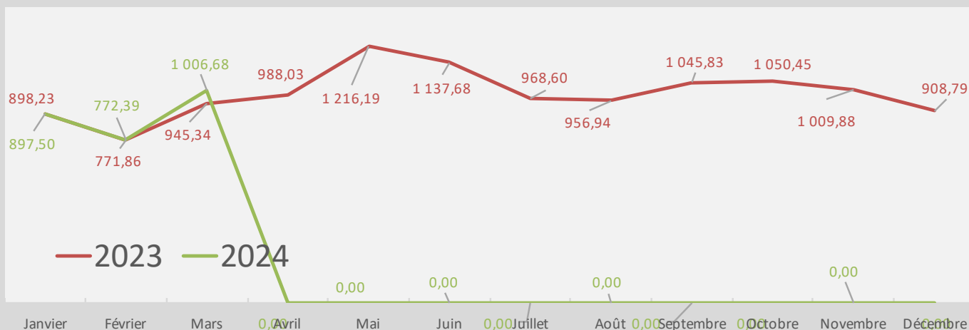
Evolution des tonnages