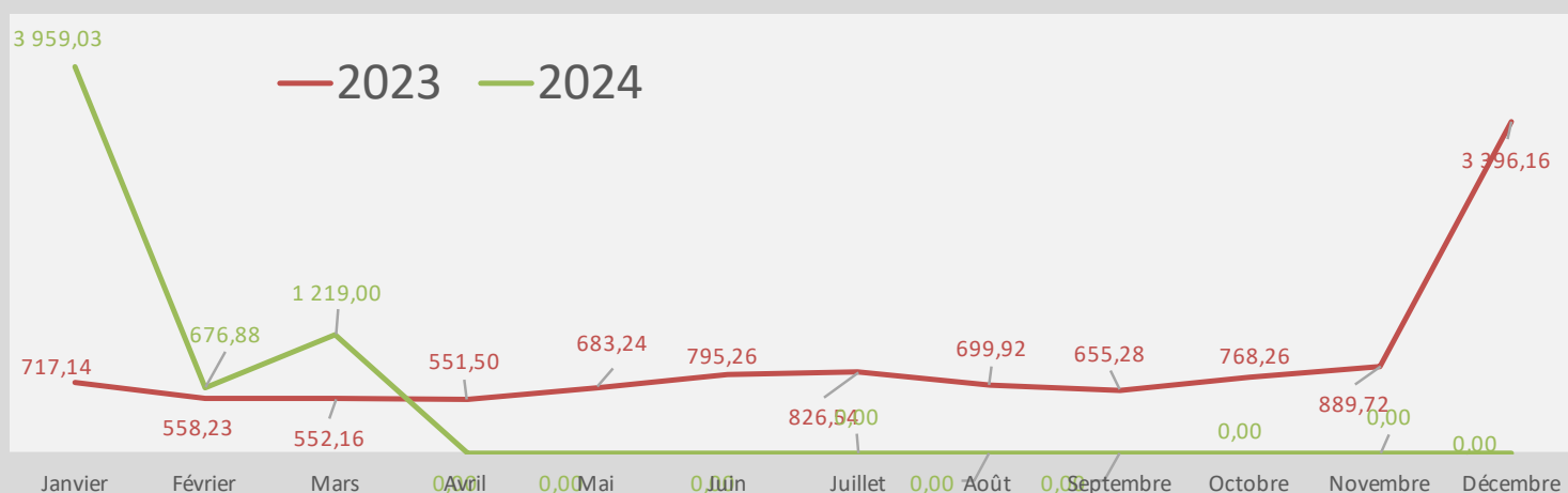
Evolution des tonnages