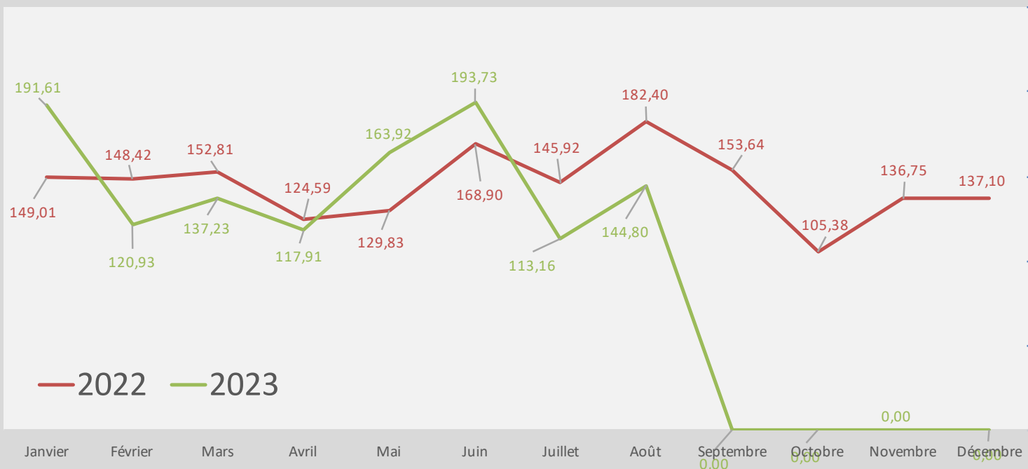
Evolution des tonnages