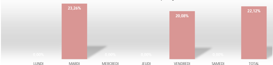
Résultats des caractérisations par jour de collecte