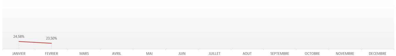
Evolution du taux de refus glissant au cours de l'année