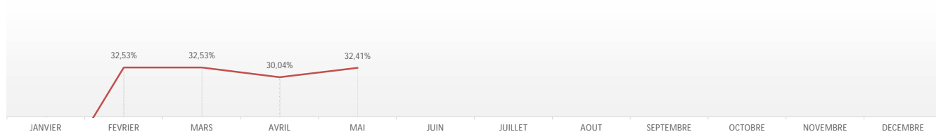
Evolution du taux de refus glissant au cours de l'année