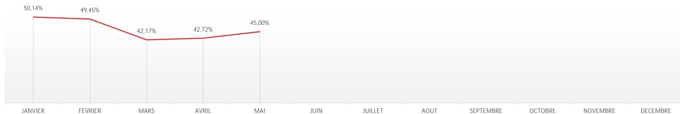
Evolution du taux de refus glissant au cours de l'année